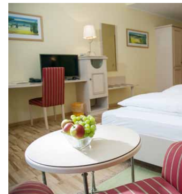
Gemütliche, entspannte Atmosphäre